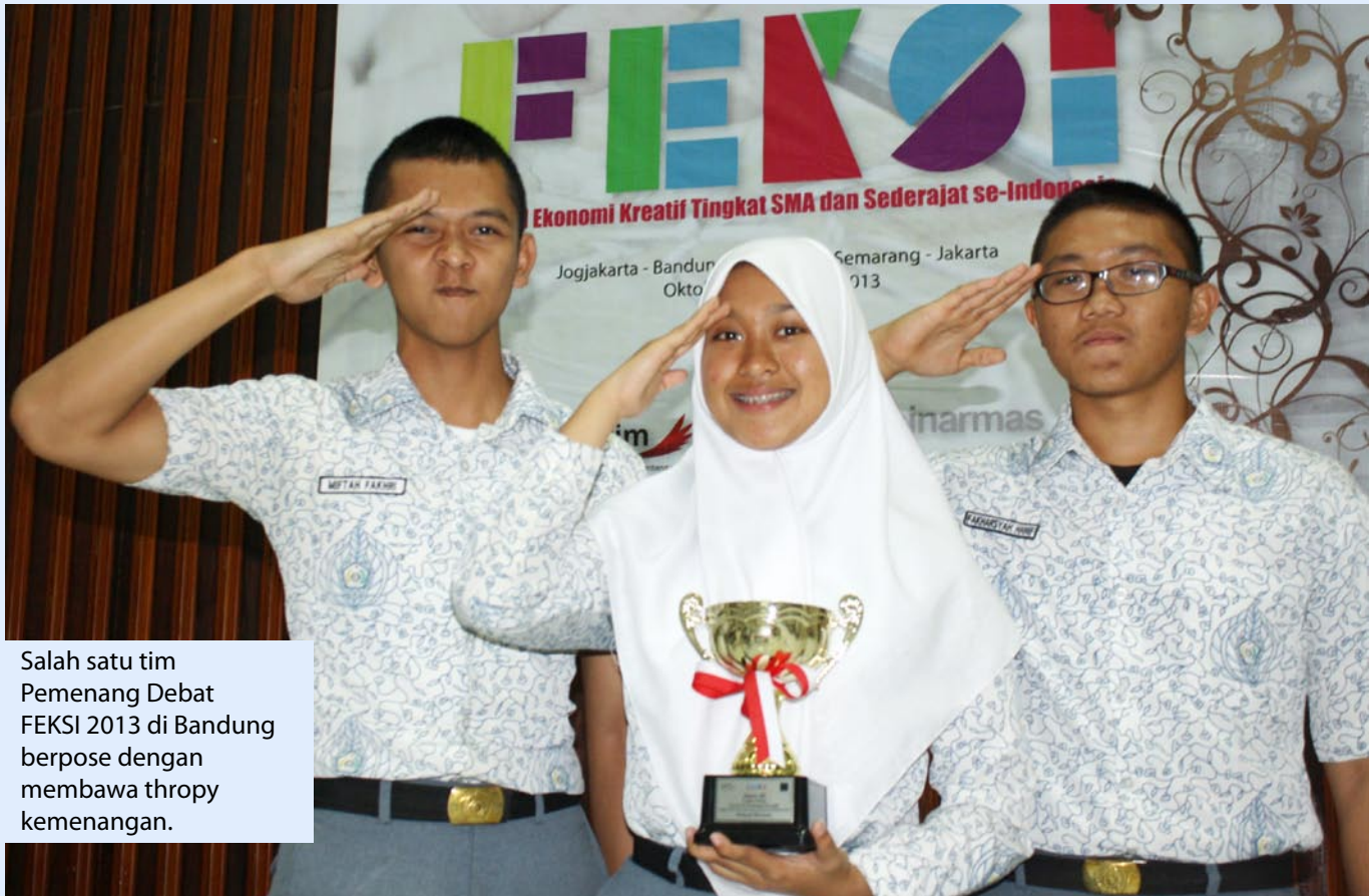
Salah satu tim Pemenang Debat FEKSI 2013 di Bandung berpose dengan membawa trophy kemenangan.

Pusat telah berhasil terhubung dengan setidaknya 300 sekolah setingkat SMA dan sederajat dari 12 kota se-Indonesia melalui kegiatan ini. Ditambah dengan aktivitas SPS Goes to Campus (SGtC) untuk mengenalkan dunia media kepada mahasiswa, lengkap sudah jejaring SPS dengan kalangan anak muda.