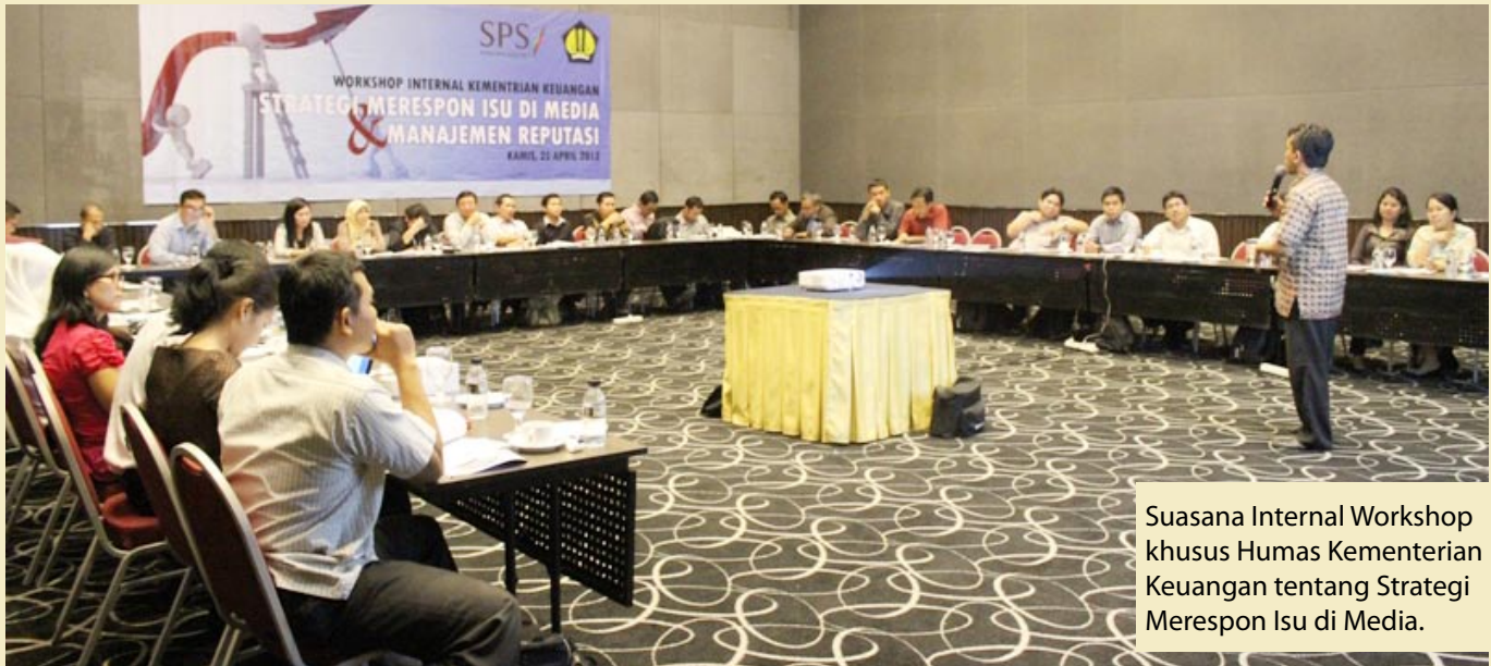
Suasana Internal Workshop khusus Humas Kementerian Keuangan tentang Strategi Merespon Isu di Media.