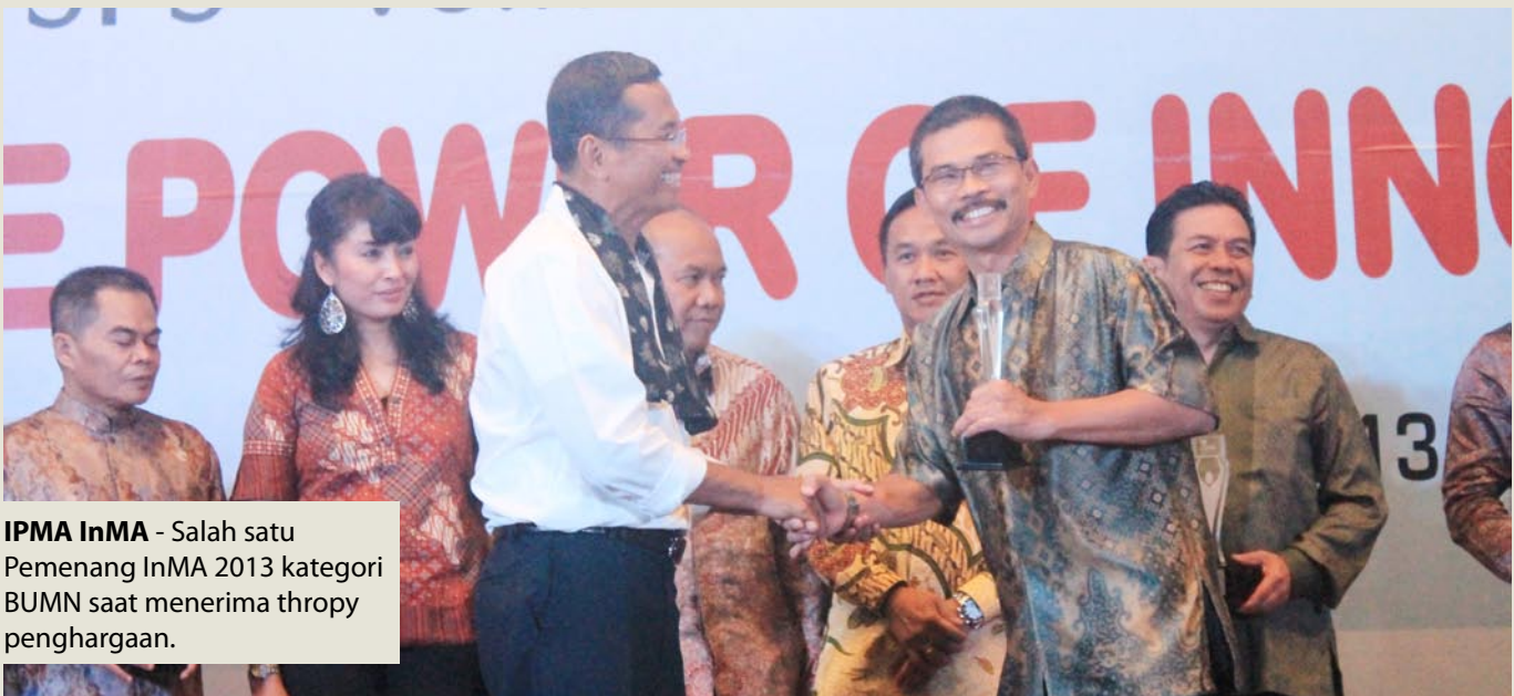
IPMA InMA - Salah satu Pemenang InMA 2013 kategori BUMN saat menerima trophy penghargaan.

Kini, pasca Kongres XXIII di Bali, SPS dipimpin oleh Ketua Umum Dahlan Iskan dan Jakob Oetama sebagai Ketua Dewan Pertimbangan. Sementara di jajaran