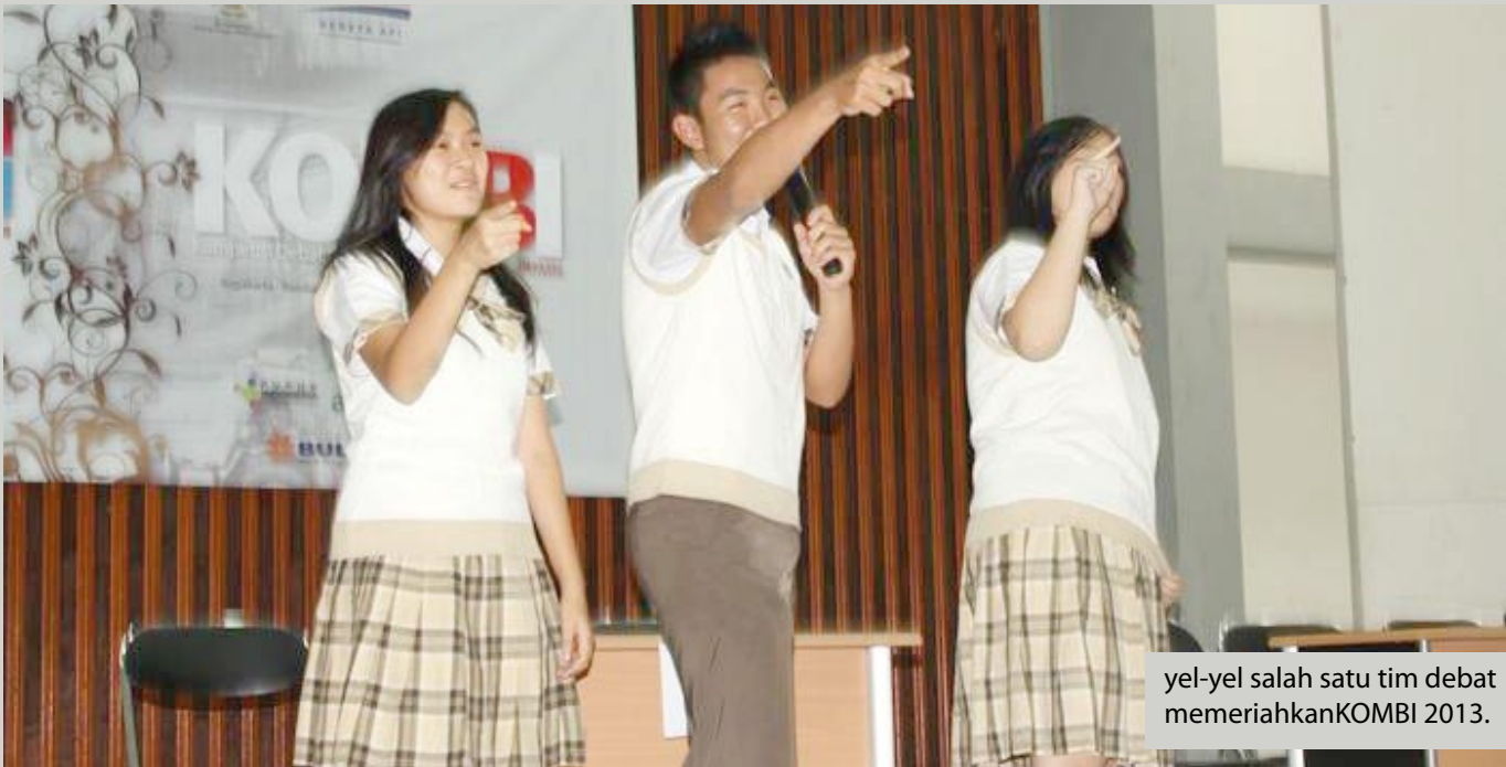
yel-yel salah satu tim debat memeriahkan KOMBI 2013.