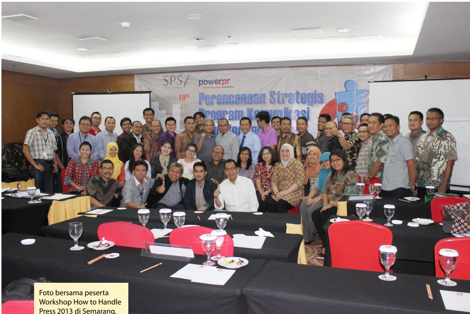
Foto bersama peserta Workshop How to Handle Press 2013 di Semarang.