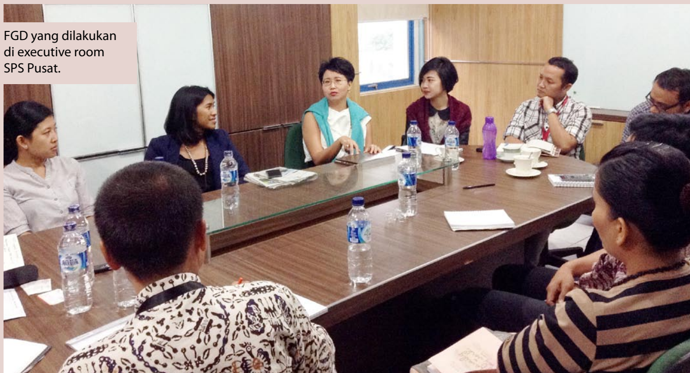
FGD yang dilakukan di executive room SPS Pusat.