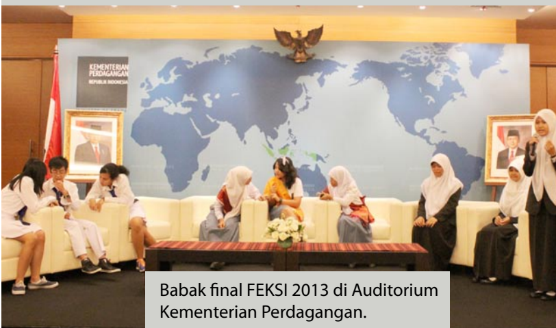
Babak final FEKSI 2013 di Auditorium Kementerian Perdagangan.