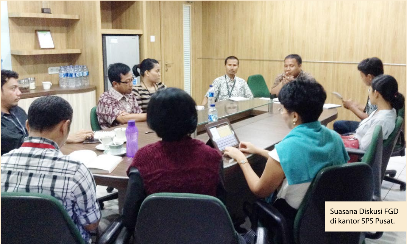
Suasana Diskusi FGD di kantor SPS Pusat.