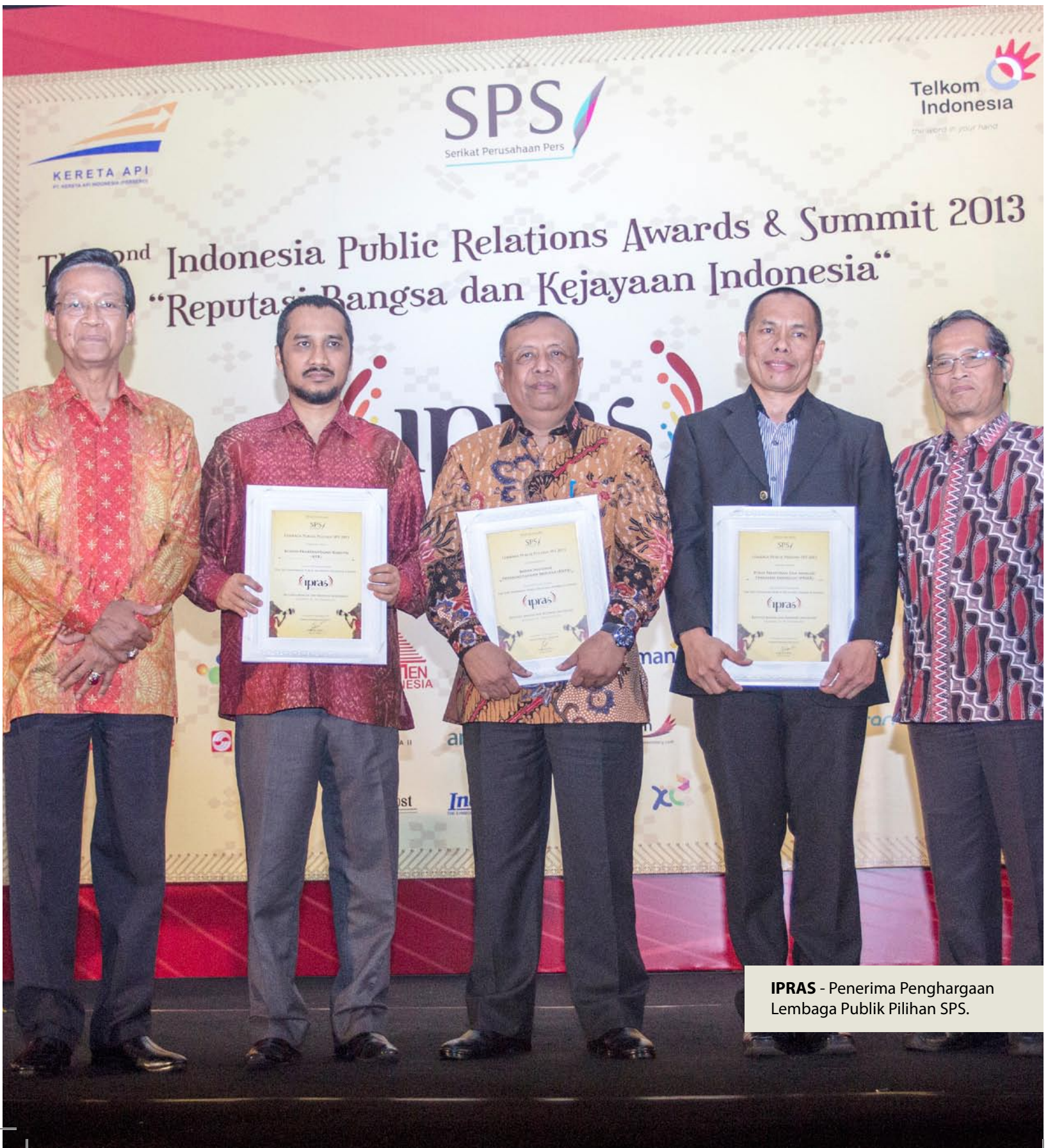
IPRAS - Penerima Penghargaan Lembaga Publik Pilihan SPS.