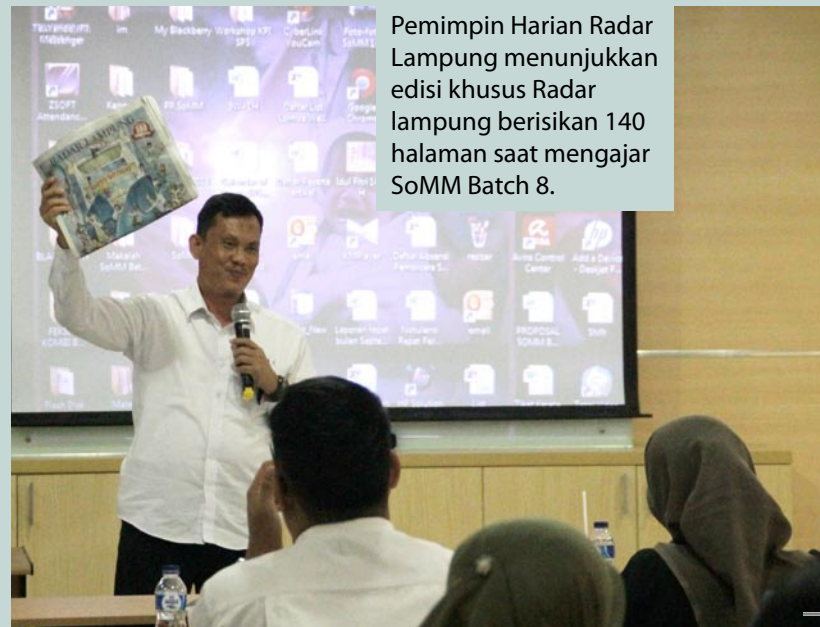
Pemimpin Harian Radar Lampung menunjukkan edisi khusus Radar lampung berisikan 140 halaman saat mengajar SoMM Batch 8.